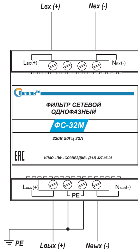
Рис.1. Порядок подключения фильтра ФС-32М.